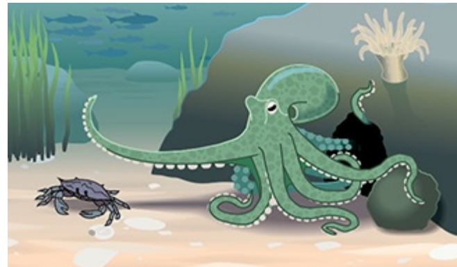
Olagarro bat, bere gordelekuaren aurrean.

Sarritan, olagarroak bakarrik bizi dira harriekin egiten dituzten gordelekuetan. Batzuetan, harrizko "ateak" ere egiten dituzte gordelekuetarako; hala, atea itxi eta seguru egon daitezke.