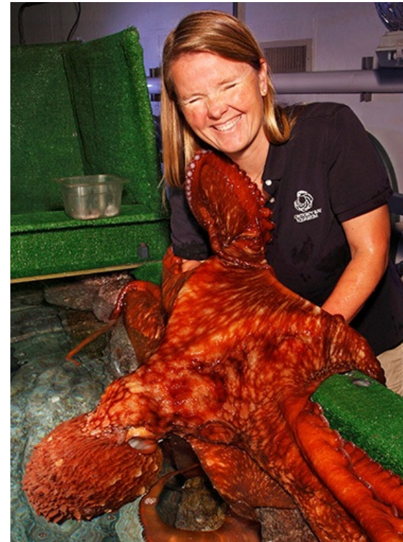
Olagarro bat, zaintzaileari besoetatik helduta.

Olagarroei janaria bezainbeste gustatzen zaie konpainia izatea. Olagarroek jaten amaitzen dutenean, garro bat altxatzen dute, eta gero beste bat, eta zaintzaileen eskuak eta besoak besarkatzen dituzte. Olagarroak eta zaintzaileak elkarri besoetatik helduta egoten dira, olagarroak zaintzaileei bentosen bidez leun helduta.