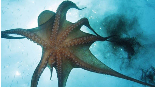
Olagarroek tinta botatzen dute, arriskutik ihes egiteko.